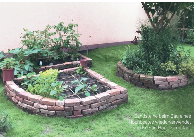
Sandsteine beim Bau eines Hochbeetes wiederverwendet von Kerstin Hau, Darmstadt